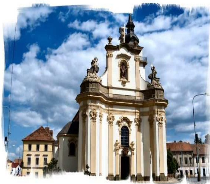
Kostel sv. Bartoloměje 1